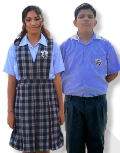
UNIFORME DE DIARIO

La presentación personal constituye un indicador que forma parte de la evaluación del comportamiento del estudiante y se reflejará no solo en su boleta de calificaciones, sino también en su certificado de conducta, en caso de ser requerido.